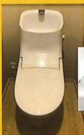
掃除のしやすい形状や節水タイプもあります。

毎日使うトイレはお家の大事な場所ですよ。日々、進化しているトイレ設備! 色々ありますが、ちょこっとだけご紹介。