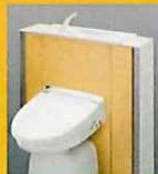
手洗機能付き収納棚